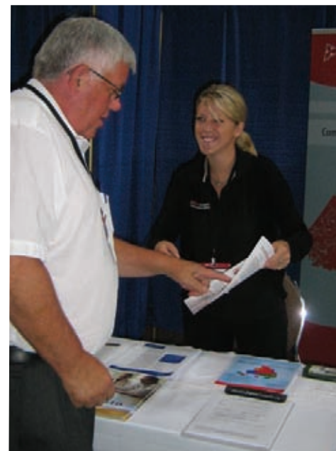
Ontario East Municipal Conference, Kingston (Ont.), septembre 2009

Pour connaître le calendrier des activités à venir, visitez le site www.ProfessionsSantéOntario.ca/CalendarOfEvents.aspx