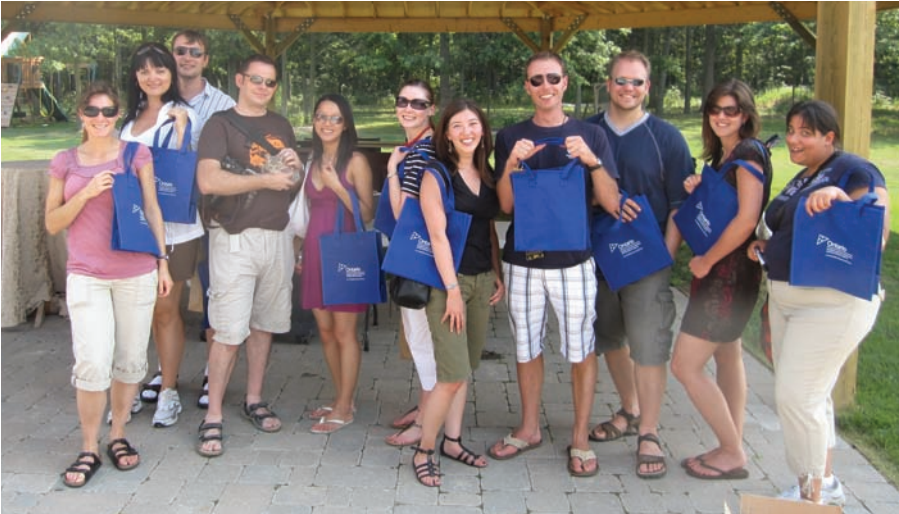
Accessoire mode : Cette année, les codirecteurs des résidents en médecine familiale de l'Université Western Ontario voulaient améliorer l'intégration des résidents en milieu rural/régional lors des activités sociales et universitaires. Cette photo a été prise à l'occasion d'une activité organisée dans la région de Windsor/Pelee, où les résidents de l'UWO ont rencontré leurs collègues de l'Université de Windsor. L'APRO a fourni une aide financière pour couvrir le coût de la nourriture et des sacs.

« La succursale des CSC NorWest à Longlac, située dans la petite municipalité de Longlac, est maintenant ciblée par les médecins à la recherche d'un emploi et fait la lutte à d'autres localités de plus grande taille du Nord-Ouest de l'Ontario pour attirer des médecins. Les efforts faits par l'APRO PSO pour amener les résidents en médecine familiale à s'inscrire à EmploisPSO en vue de trouver un emploi dans la province y sont pour beaucoup. »